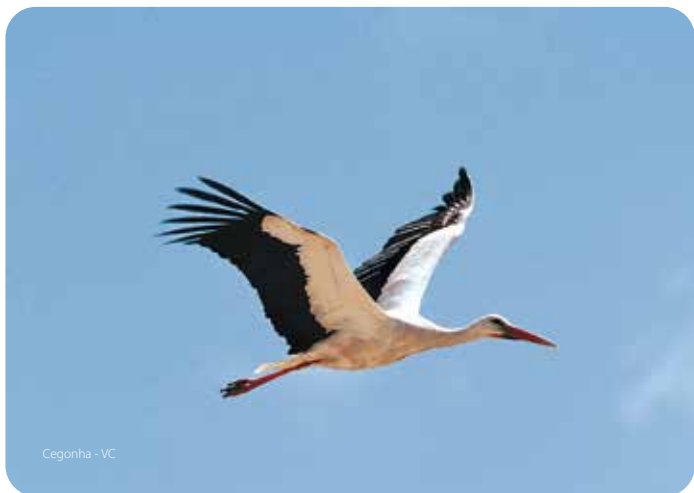
Cegonha - VC