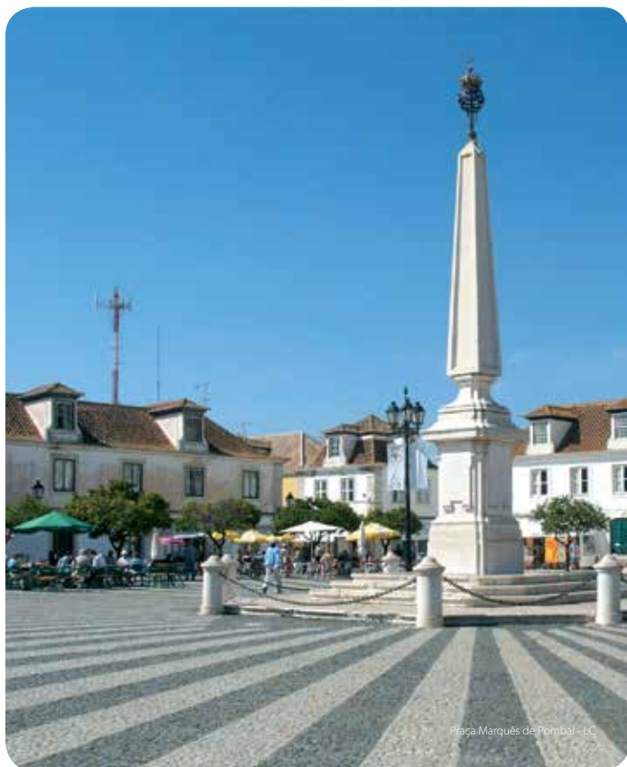
Praça Marquês de Pombal - LC

Para apreciar o plano urbanístico de Vila Real de Santo António é necessário passear pelas suas ruas. Importa começar pela Praça Marquês de Pombal, coração da vila, de empedrado radiante a partir do obelisco erguido em 1776. Ela contém três dos principais elementos urbanos do séc. XVIII: a igreja, a Câmara Municipal e a antiga casa da guarda (hoje edifício de um banco). Depois, devem percorrer-se alguns quarteirões, erguidos já por iniciativa particular, mas em que é ainda aparente um formulário arquitetónico. A linha de fachadas da Avenida da República, delimitada por dois torreões e contendo o edifício da antiga alfândega, de largo portal e frontão triangular, é o final do percurso. Está-se junto às margens ajardinadas do rio Guadiana, tendo em frente a cidade espanhola de