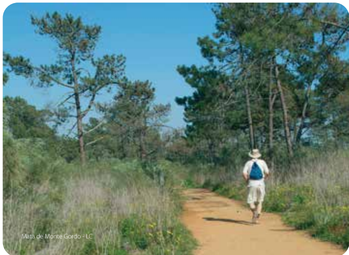
Mata de Monte Gordo - LC

A sombra fresca dos pinheiros da mata nacional, que liga Vila Real de Santo António a Monte Gordo, é um convite a revigorantes passeios e ao conhecimento da sua flora e fauna.