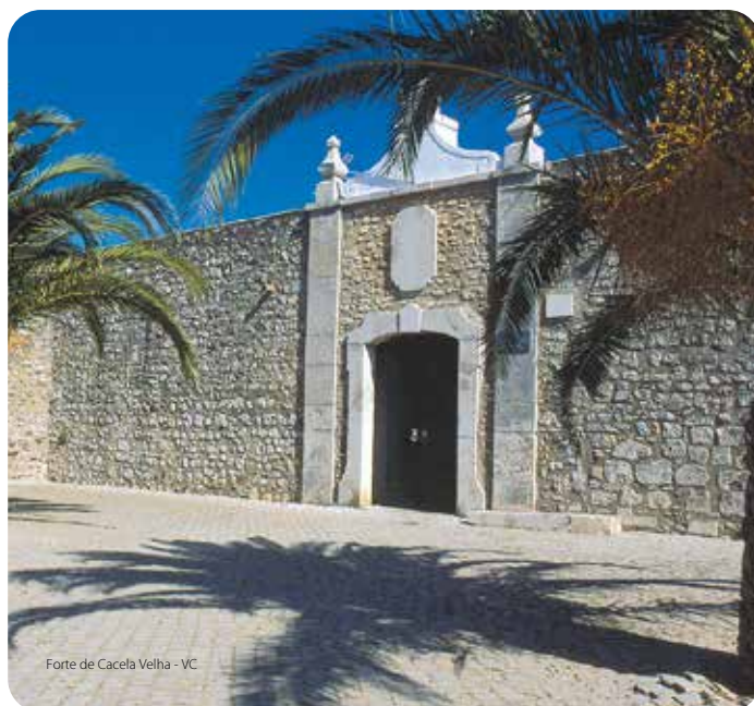
Forte de Cacela Velha - VC

De forma poligonal, foi reconstruído no final do séc. XVIII.