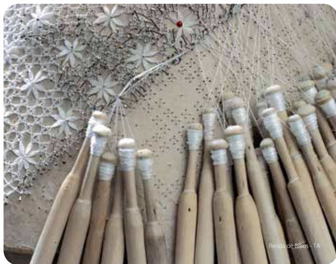
Renda de Bilros - TA

As finas rendas de bilros, desde sempre associadas às mulheres dos pescadores, marcam de forma indelével a arte do concelho e continuam a ser produzidas em Vila Real de Santo António. De outros tempos são também os arreios e os molins decorados com lã colorida, executados por albardeiros e usados pelos muarens nos trabalhos agrícolas do interior serrano. Atualmente, os novos caminhos do artesanato são exemplificados pelas marionetas, para teatro ou para coleção, pela cerâmica, caso das tradicionais chaminés, pela cestaria e empreita ou ainda pelos trabalhos em madeira ou azulejo.