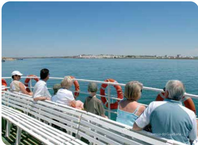
Travessia do Guadiana - LC

Correndo entre montes alegres pelas flores silvestres e pelo verde de sobreiros e pinheiros, o rio Guadiana faz, desde há séculos, a fronteira entre Portugal e Espanha. A partir de Vila Real de Santo António, barcos realizam, com regularidade, a subida turística do rio. Oportunidade para conhecer um Algarve diferente, admirando o casario branco de aldeias debruçadas sobre a água, com o milenário castelo de Alcoutim guardando o rio.