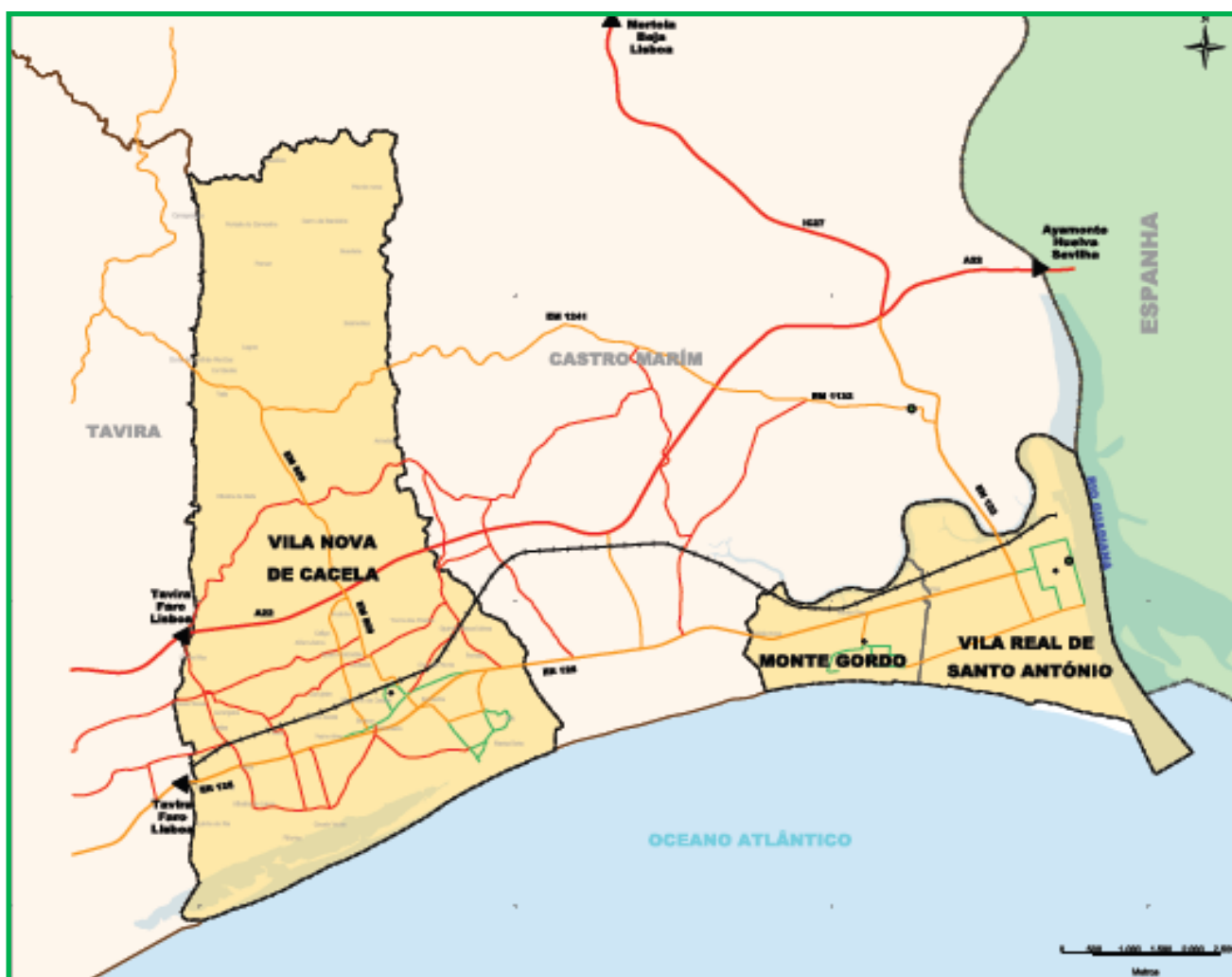
Fig. 1 – Mapa do concelho de Vila Real de Santo António

Este Concelho faz fronteira a norte com o Concelho de Castro Marim, a sul com o Oceano Atlântico, a este com o Rio Guadiana e a oeste com o Concelho de Tavira.